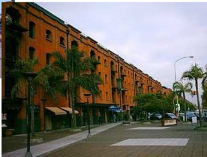
Puerto Madero – Buenos Aires - Argentina