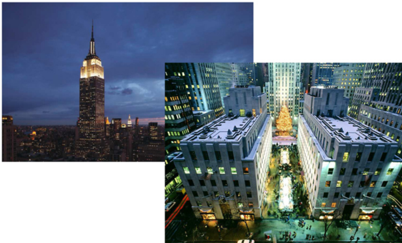
Greener Greater Building Plan – NY - USA