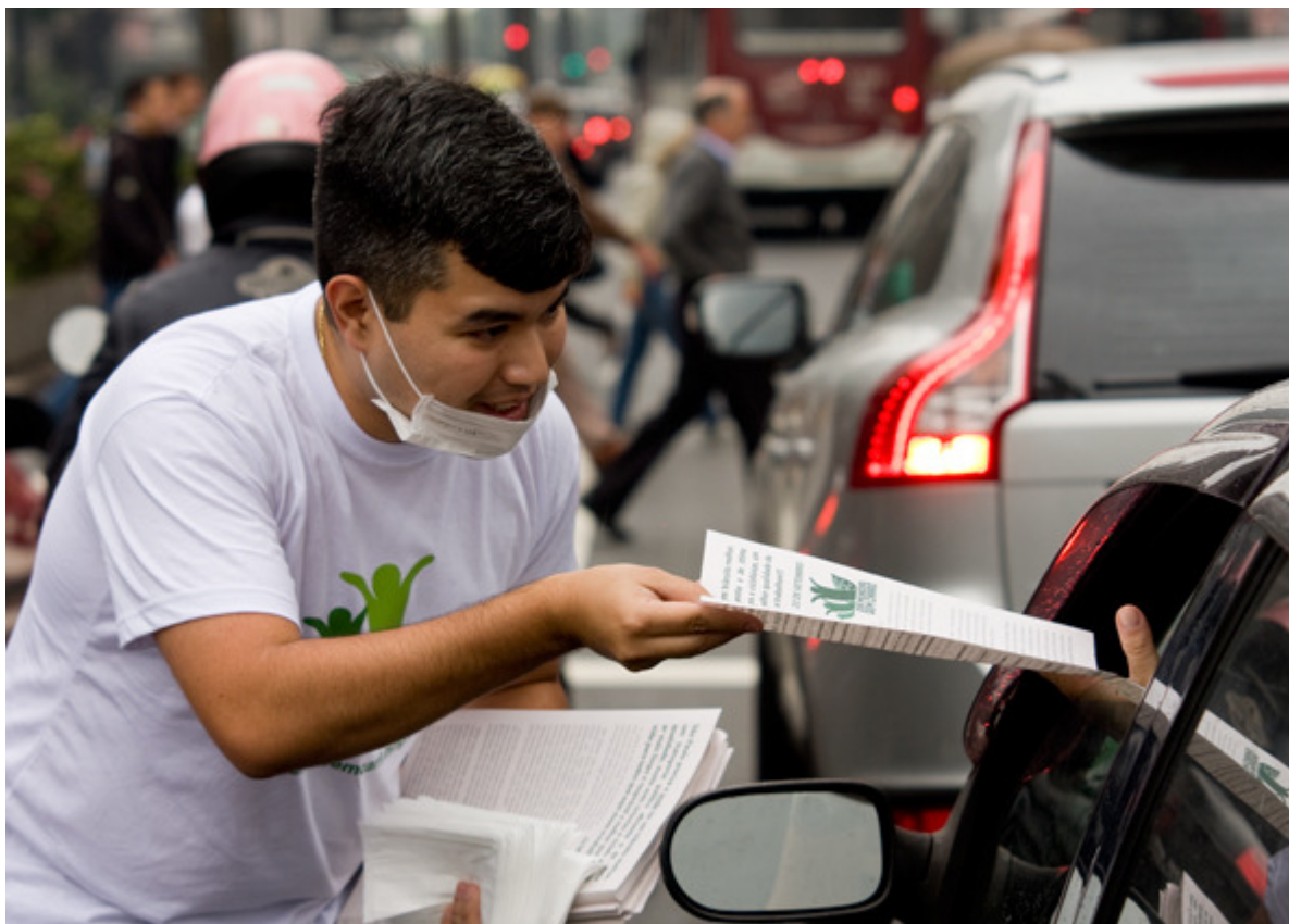
Participante de manifestação, com máscara, entrega folhetos sobre o Dia Mundial Sem Carro em semáforo na Avenida Paulista